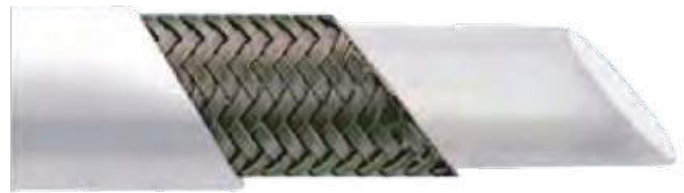
技术参数 Technical Data