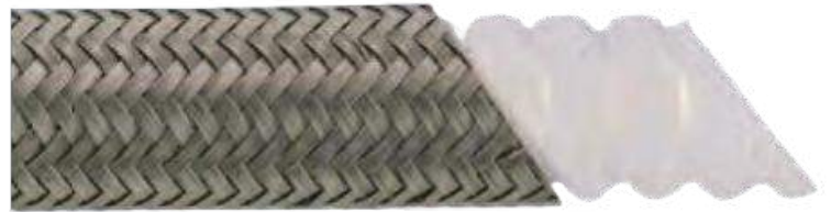
技术参数 Technical Data