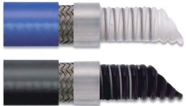
技术参数 Technical Data